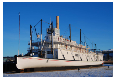
ホワイトホース市内観光